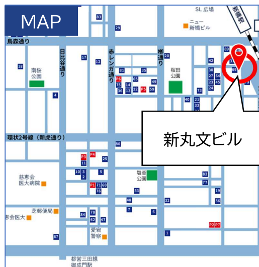
港区に管理物件が多数ございます。