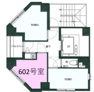
◇ 図面が現況と異なる場合、現況を優先とさせていただきます。